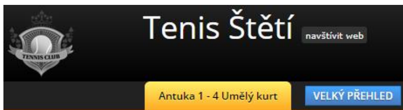
Obrázek 6: přepínání zobrazení

Přepínání mezi těmito přehledy se provádí kliknutím na modré tlačítko Detailní přehled / Velký přehled na úvodní obrazovce.